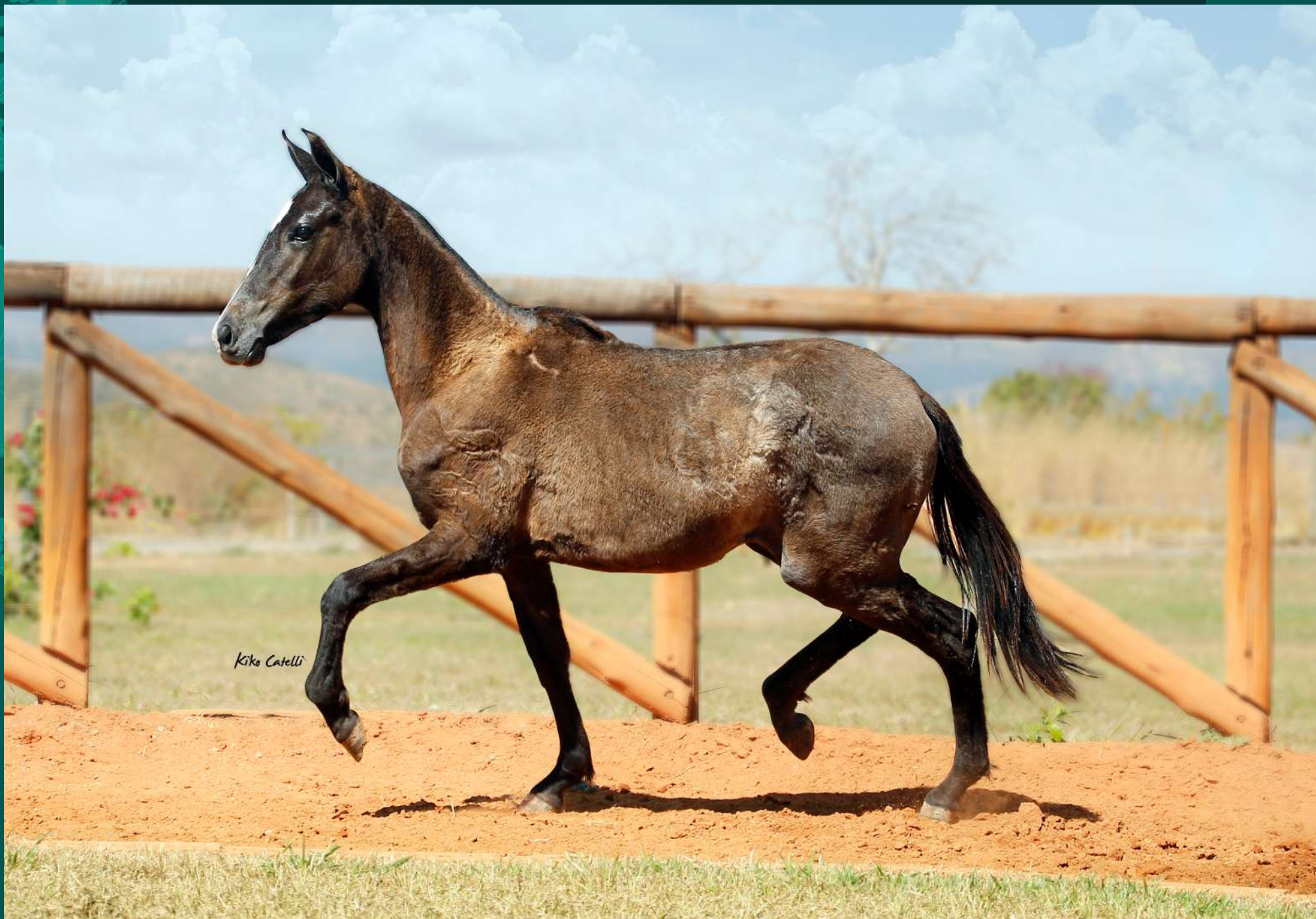
Seu Pai DANÇARINO SERRA BELA