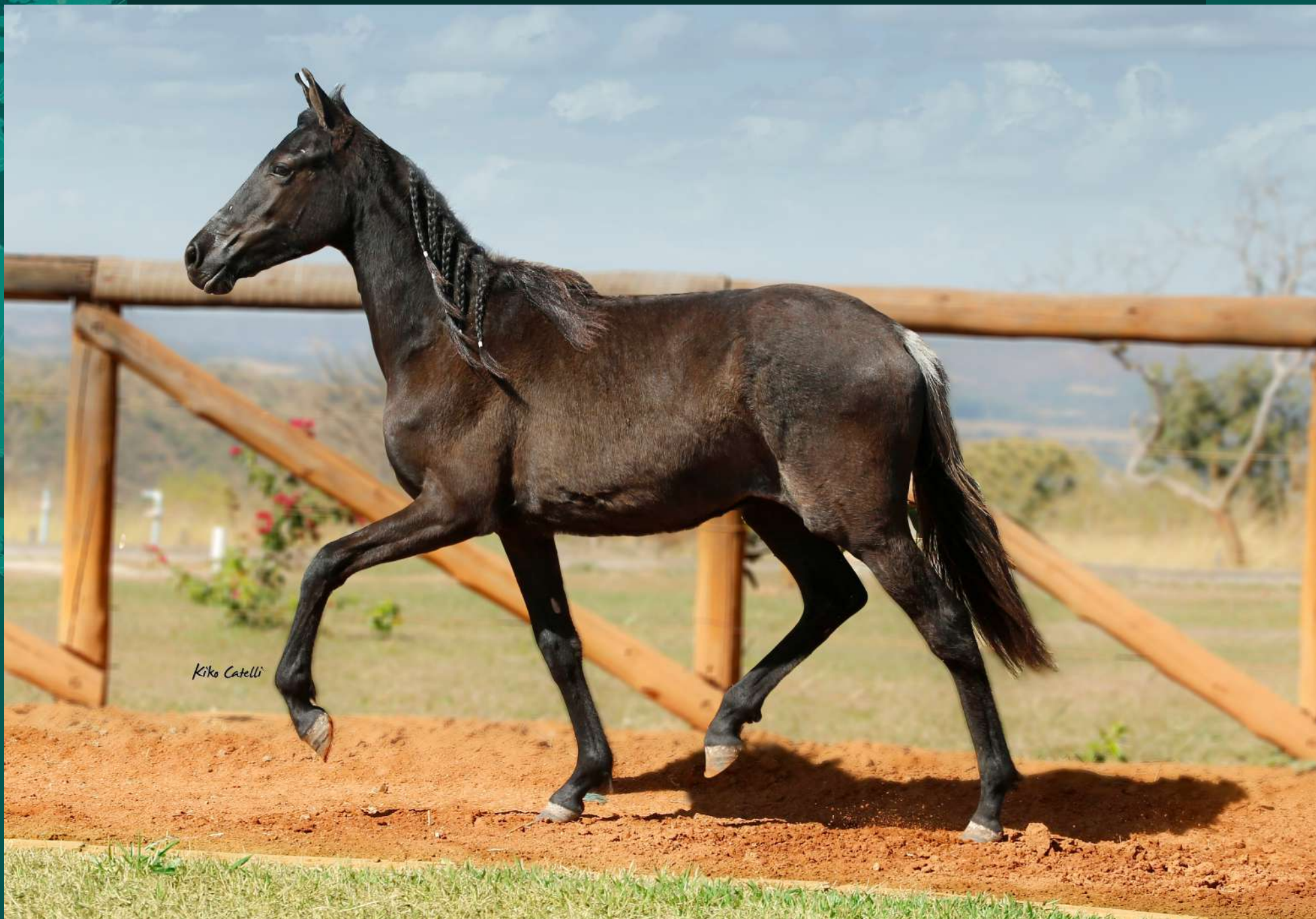
Seu Pai DANÇARINO SERRA BELA